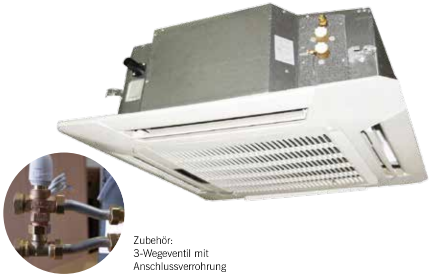
Zubehör: 3-Wegeventil mit Anschlussverrohrung