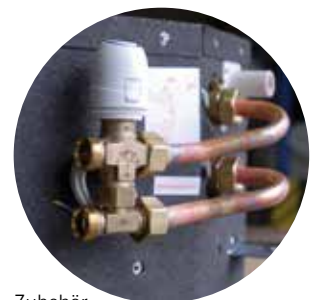
Zubehör: 3-Wegeventil mit Anschlussverrohrung